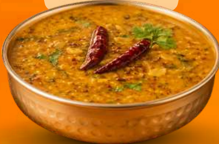
DAL KA DARBAR