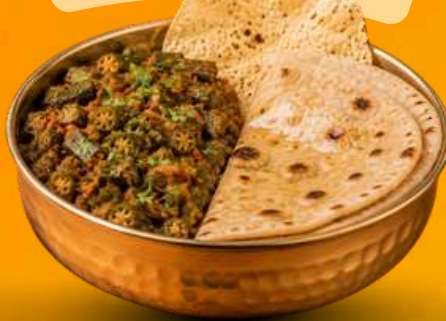
KATHIYAWADI FIX DISH