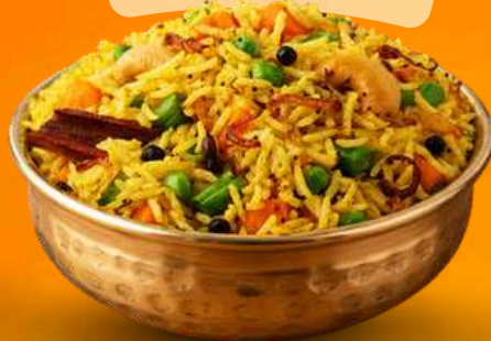
RICE KI RASLEELA