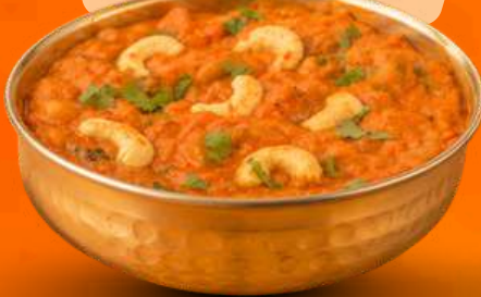
PUNJAB KE KHET SE